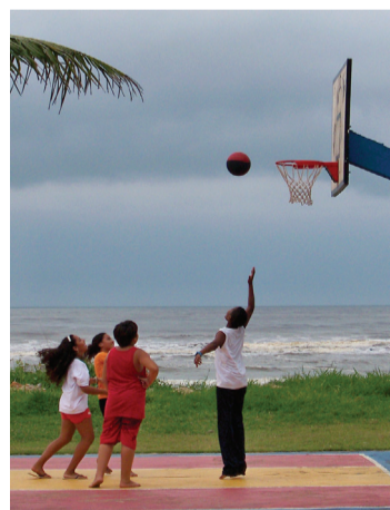
Crianças jogando na quadra da Praia do Centro de Itanhaém