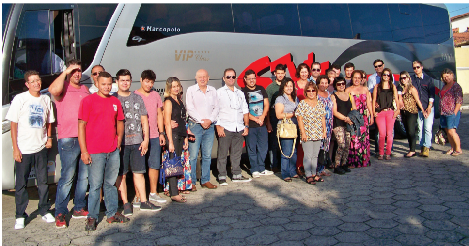
Participantes do Missão que contou com empresários de Itanhaém, Peruíbe, Mongaguá e Praia Grande

com muitos temas e para todos os tipos de setores comerciais. Também tinham muitas novidades e tendências que foram lançadas no evento. Com certeza foi muito proveitoso para todos os comerciantes e empresários que tiveram a oportunidade de conferir”.