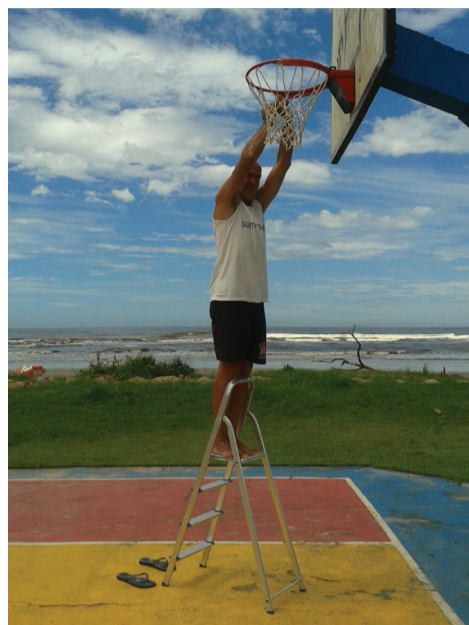
Carioquinha colocando a nova rede

Eu vejo o esporte como um grande caminho para nossas crianças e jovens, onde existe uma grande confraternização. No esporte você convive com todas as classes se não se tornar um atleta de alto rendimento, pelo menos existe um caminho para se tornar um grande cidadão.